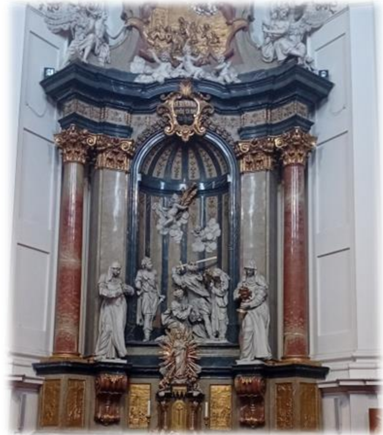
Socha Sv. Barbory a jejího otce