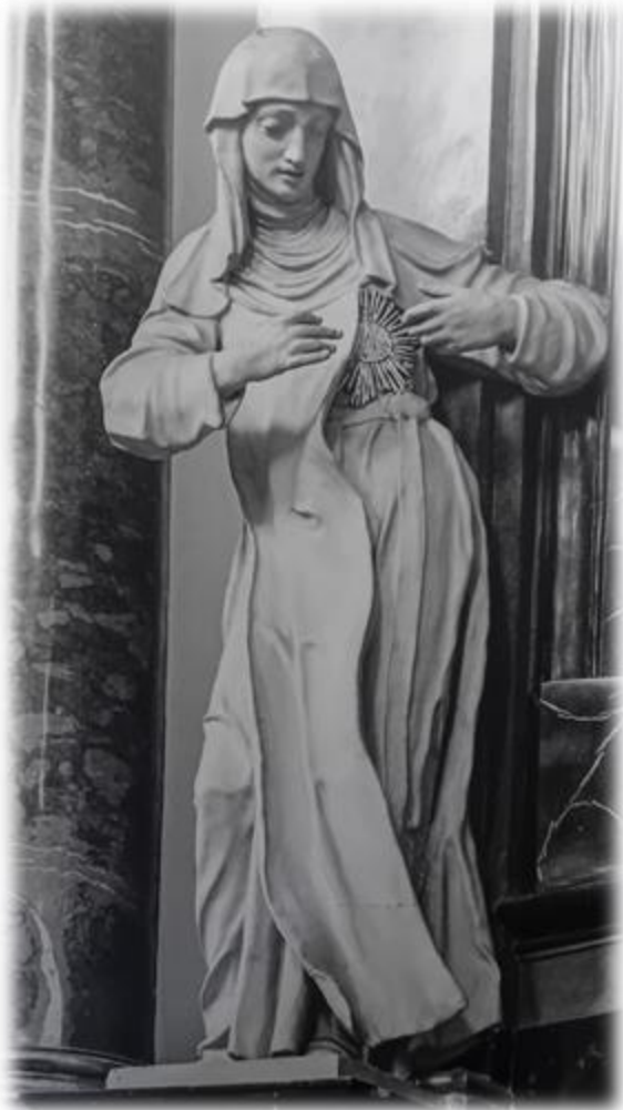
Sv. Juliana Falconieri