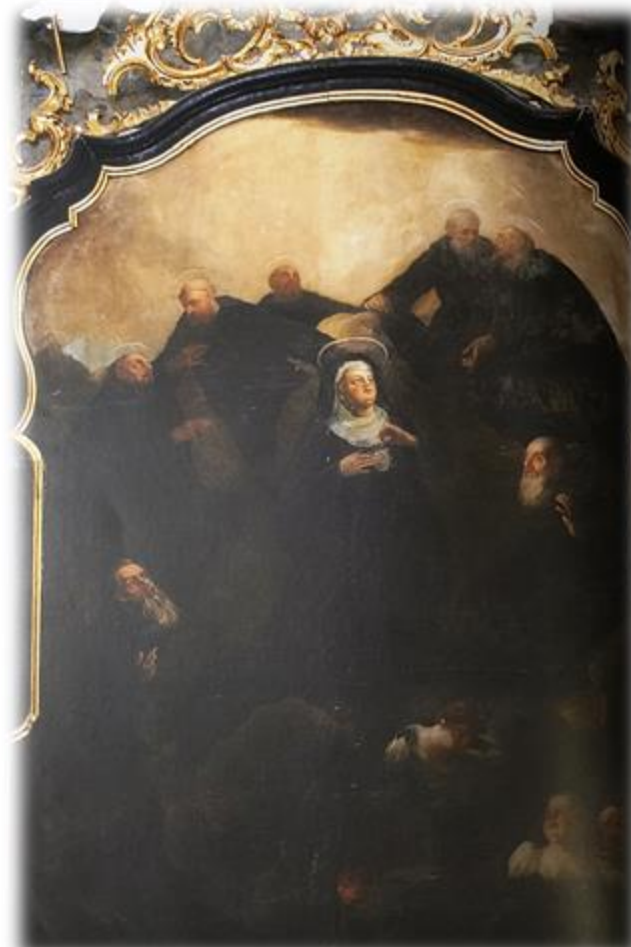
Obraz Sv. Juliany Falconieri