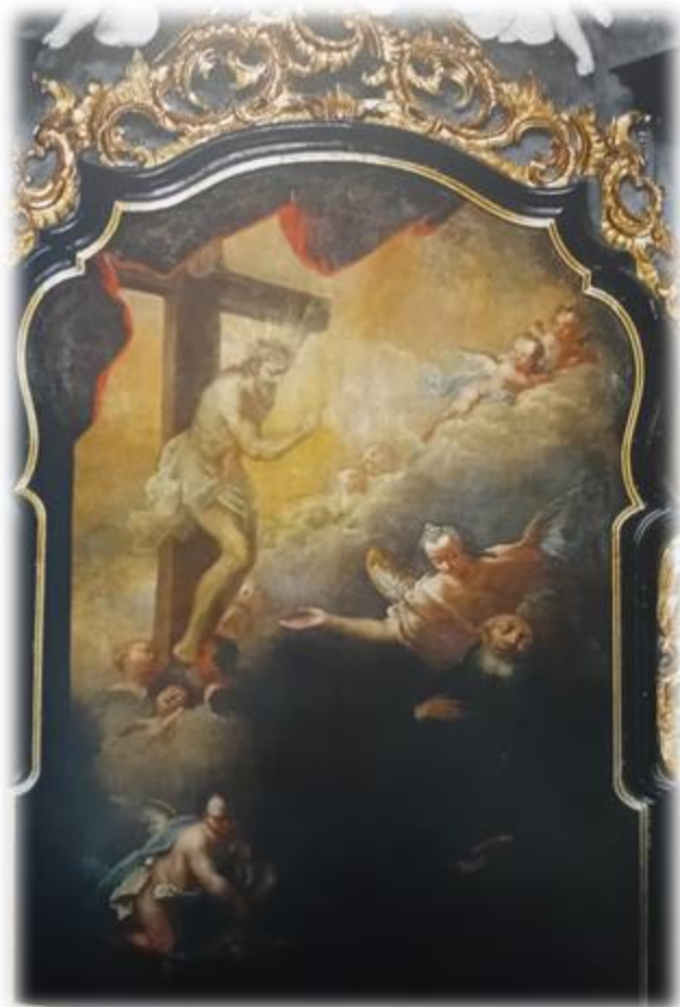
Obraz Sv. Peregrina