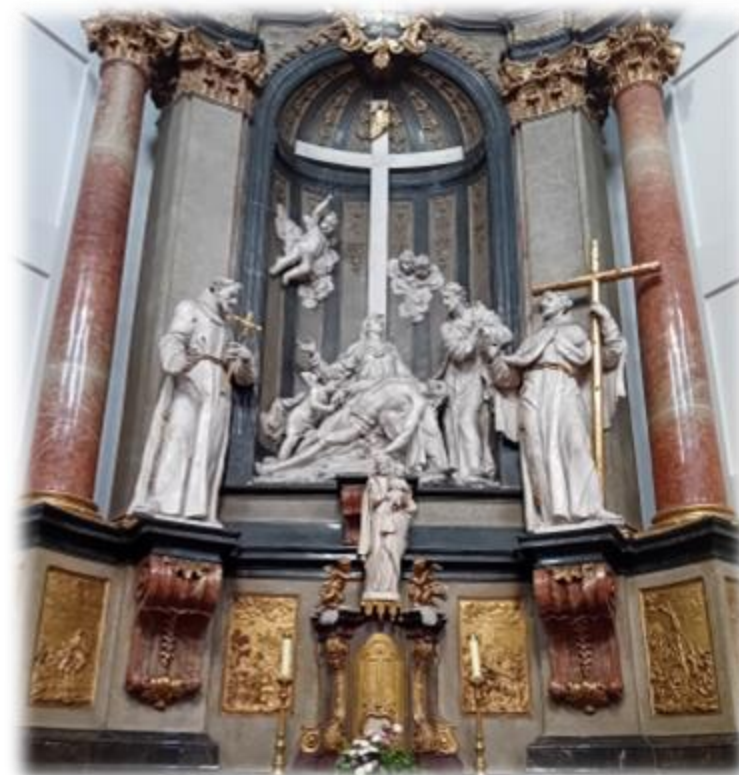
Znázornění umučeného Krista, ležícího v klíně matky