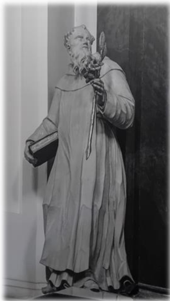
Sv. Tomáš Akvinský