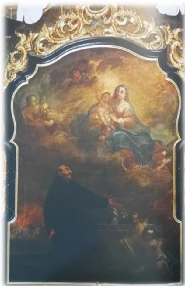
Obraz Sv. Filipa Benicia