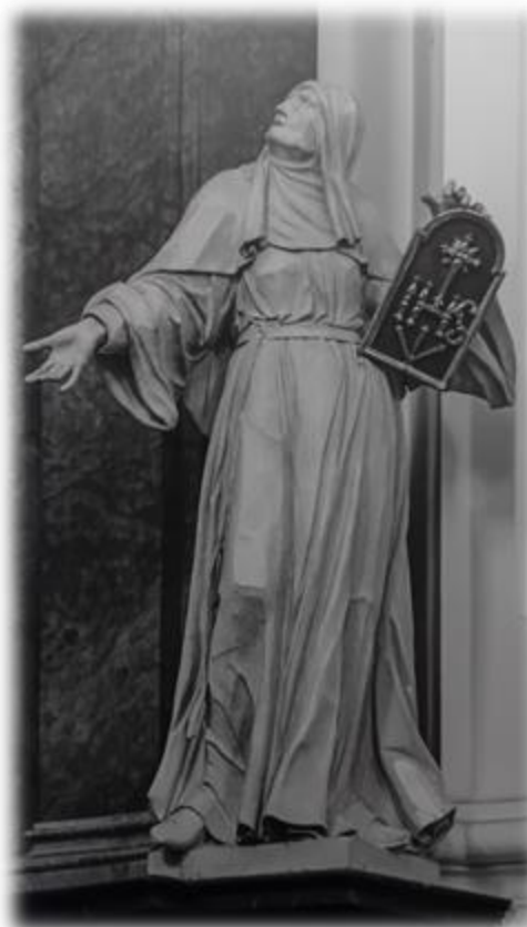
Sv. Terezie od Ježíše