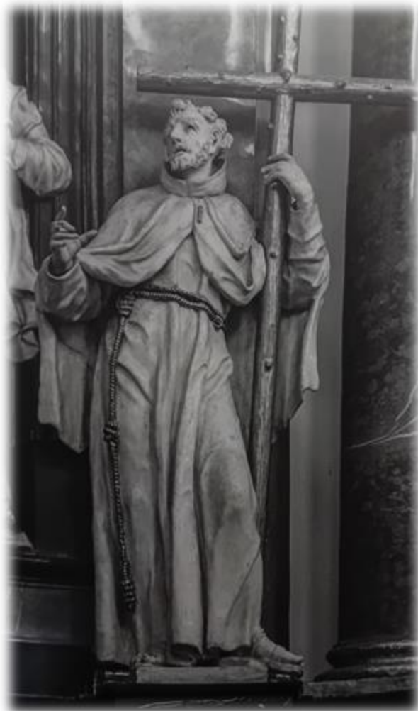
Sv. Petr z Alkantary