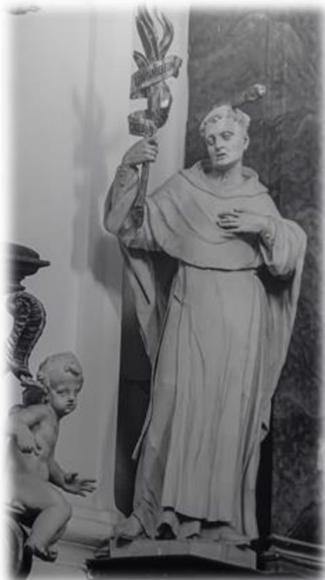
Sv. Petr Veronský