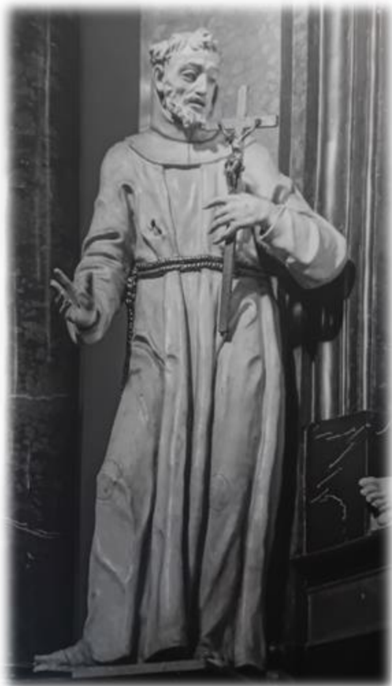
Sv. František z Assisi