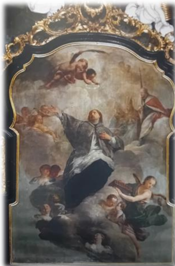
Obraz Sv. Jana Nepomuckého